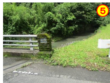
馬渡：馬渡橋（馬渡川） 《ガードレールの隙間が広い》