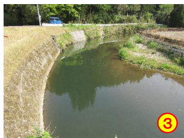
前川内～岩穴（久留味川） 《ガードレールがない》