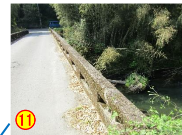
黒葛原：下原橋（金山川） 《欄干が低い》