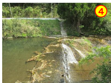
前川内～岩穴（久留味川） 《川へ降りられる》