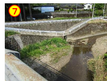
小原：あぜち橋（馬渡川） 《川へ降りられる》