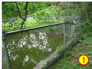
馬渡：貯水槽 《立入禁止区域》