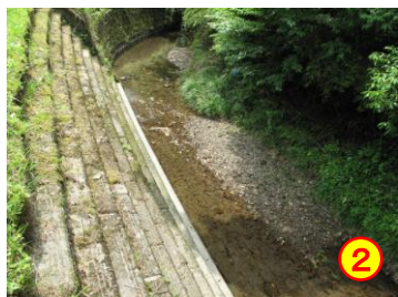
馬渡～前川内（馬渡川） 《川へ降りられる》