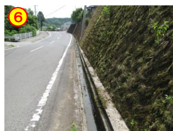
第3山住住宅 周辺道路 《側溝のふたがない》