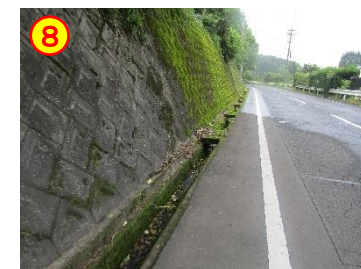
小原～赤水 周辺道路 《側溝のふたがない》