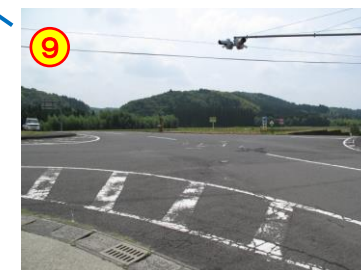
赤水交差点 《横断歩道がない》